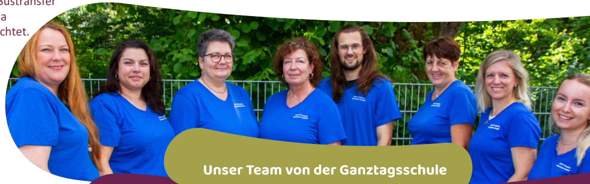
Unser Team von der Ganztagschule

Für Kinder aus Reichenkirchen, die an der OGTS teilnehmen, ist von Montag bis Freitag nach Schulschluss ein Bustransfer zur OGTS in Maria Thalheim eingerichtet.